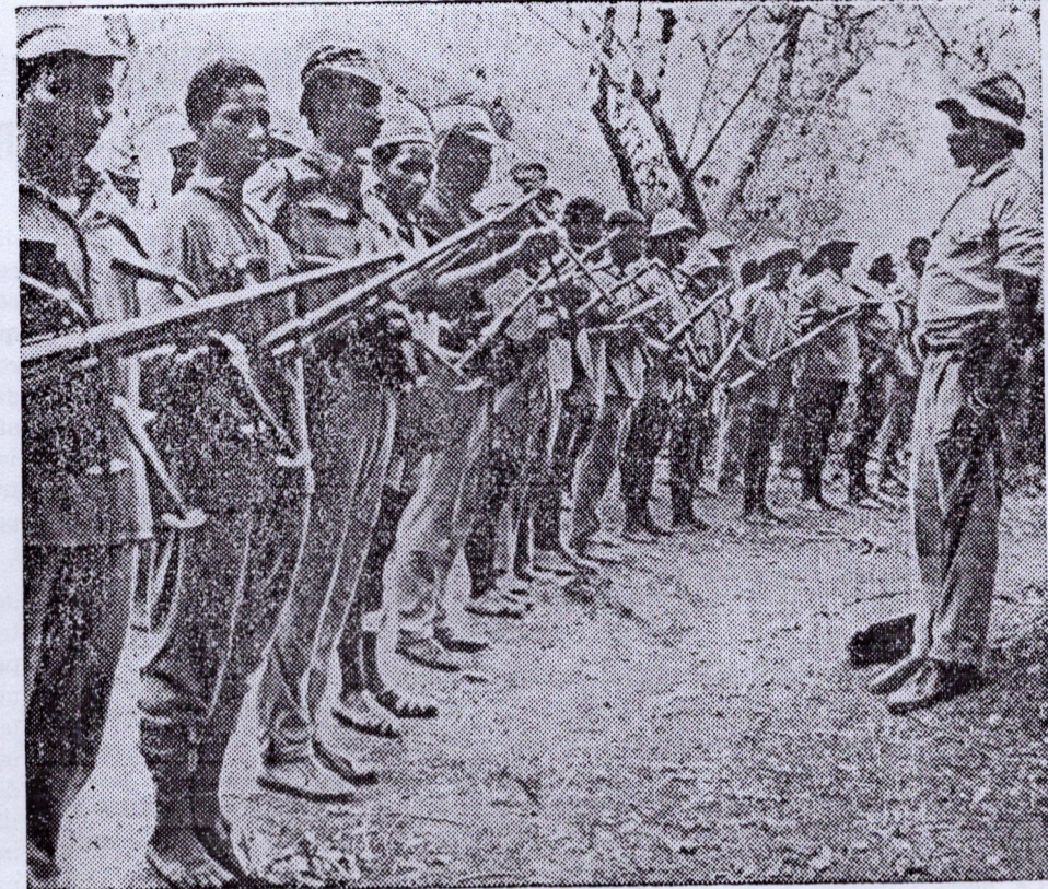
Debout, armes à la main, les nationalistes des territoires sous domination portugaise intensifient quotidiennement leurs luttes et s'apprêtent à se battre jusqu'à la victoire finale.

clarant que le gouvernement du Portugal serait « prêt à entreprendre de promptes discussions concernant ses provinces d'outre-mer ».